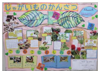
学校法人たから学園 認定こども園たから幼稚園