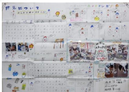
ガールスカウト福岡県第13団