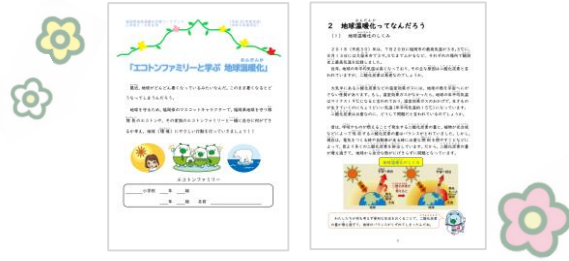
地球温暖化対策ワークブック(小学校5・6年生用)

学校の授業での活用のほか、家庭での長期休みの課題、調べ学習やグループワークにも活用できる教材です。県ホームページに掲載していますので、ダウンロードしてご活用ください。