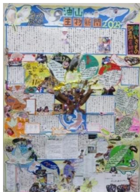
ぶらぶらあぶらクラブ