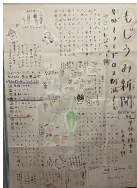
ライジングアップ