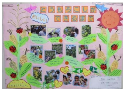
学校法人たから学園 認定こども園たから幼稚園